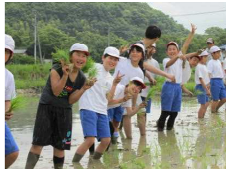
【5年生カブトエビ農法の田植え】