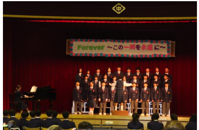
1年生合唱「マイ・バラード」