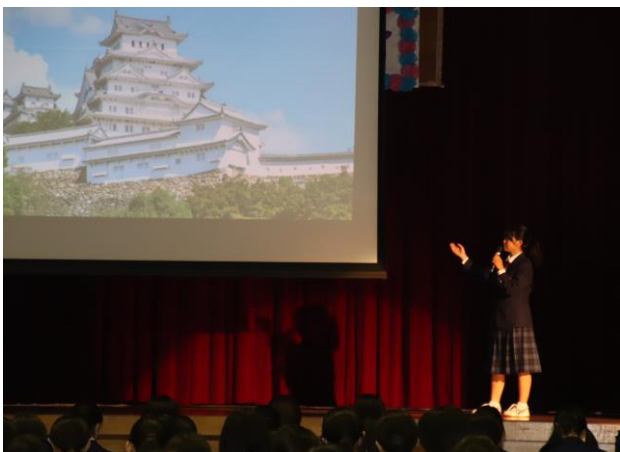
有志発表①: 英語弁論