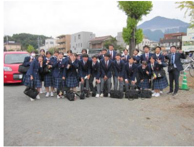
会場近くの公園にて

11月1日(金)、秩父地区小中音楽会が開催され、本校からは3年生が出場しました。体調不良の生徒が多く、なかなか練習が難しかったのですが、本番では柔らかく、優しい合唱をつくりあげていました。講評では、「言葉の波を理解して歌えています。」「音楽が立体的に聞こえます。」等のコメントが寄せられました。