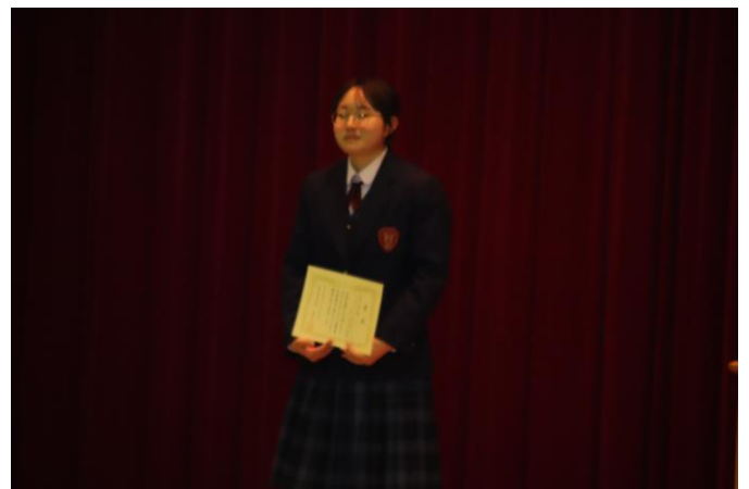
閉会式:スローガン賞受賞