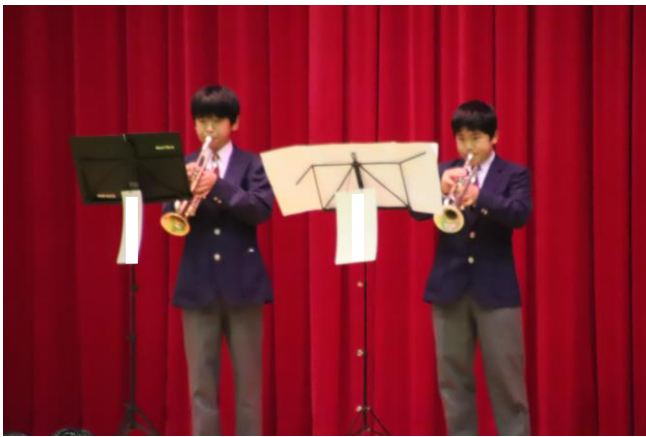
有志発表③:文化部・吹奏楽の発表