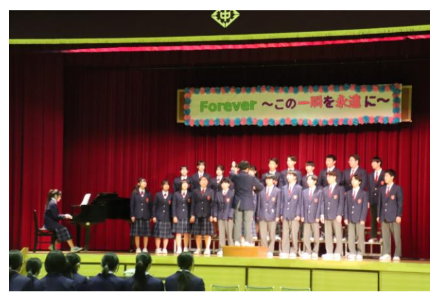
3年生合唱「手紙～拝啓十五の君へ」