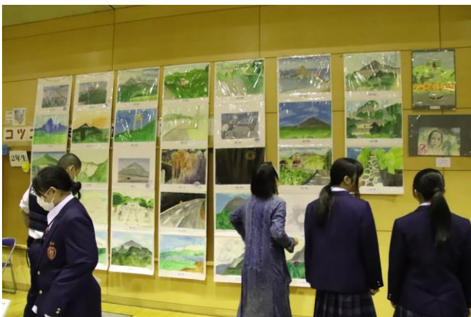
会場:多くの人の目にとまった美術作品