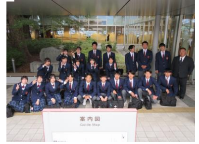
会場前で集合写真