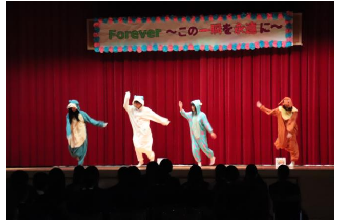
有志発表④:ダンスの発表①