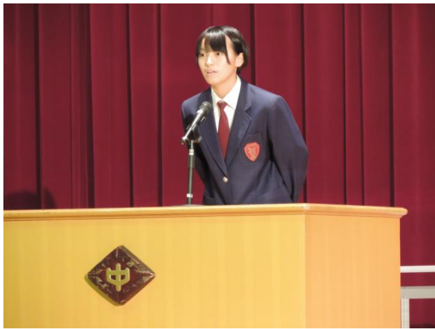
開会式: 実行委員長の話