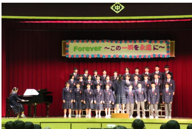
2年生合唱「ハートのアンテナ」