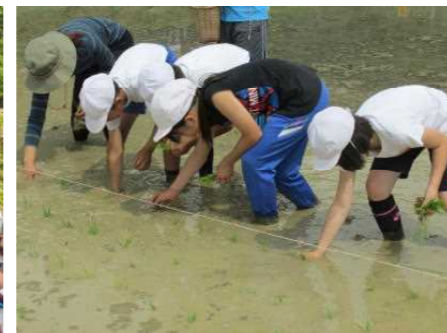
【3年生高齢者生産活動センター】