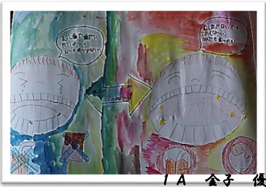
1 A 金子 優亜