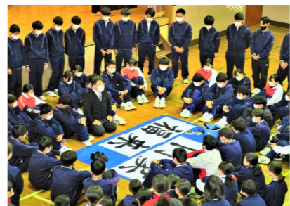
始業式(校長書きぞめ)