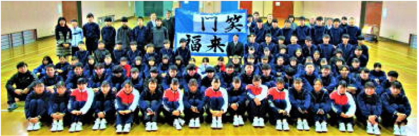
『笑門来福』～3学期始業式後、全校で記念写真を撮りました。

尾田蒔中学校では生徒が、安心して安全にスマホ等の機器が使えるように、ネットトラブル防止プロジェクトをさらに進展させ「SMAP」(スマホ安心安全活用プロジェクトチーム)を発足します。2月から活動を開始し、各クラスで生徒総会に向けて議論を重ね、『スマホの使い方宣言』を考えて発表してもらう予定です。家庭でもスマホ等の使い方について生徒と一緒に考えていただければ幸いです。