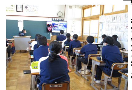
「被災者から学ぶ」防災教室(Zoom)