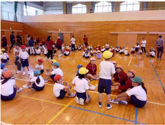
縦割り班 初めての顔合わせの様子

私は、西小の子供たちはみんな心が優しいと感じています。友達に優しく接することができ、相手を思いやって行動することができる本校の子供たちは本当に素晴らしいと感じています。