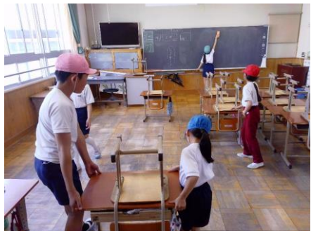
縦割り班清掃の様子

なぜ本校の子供たちは、みんな優しい子供たちばかりなのか？ その理由の一つは、縦割り班活動にあるのではないかと思います。1～6年生で10人程の班をつくり、清掃や遠足などを行う縦割り班活動を本校では行っています。異年齢集団で活動するその様子を見てみると、友達を気遣う場面を多々見受けれます。活動をとおして、協力することの大切さ、相手の思いを押し量る大切さを学んでいるのではないかと感じます。今後も縦割り班活動を充実させ、子供たちの心を大きく育てていければと考えております。