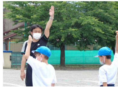
【交通安全教室での歩行指導の様子】

また、本校では、高学年が「新型コロナウイルスに負けない西小学校にする」というミッションの実現に向け、プロジェクトを組み、委員会活動の一環として、自分たちにできることを検討し、活動の計画を立てています。