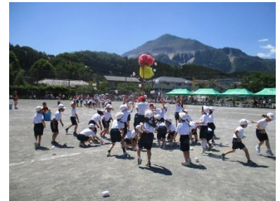
1・2年チェッコリ玉入れ

安全が確認されるまで、休日を含め立ち入り・使用はできません。ご理解とご協力をお願いいたします。