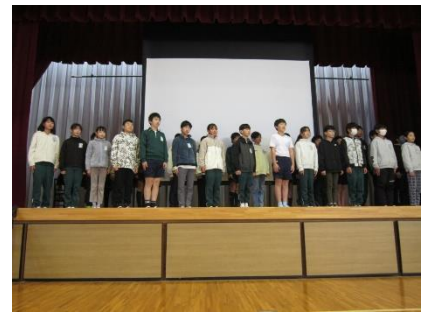
活動報告会の様子（6年生）

先日は、ご多用の中、休日授業公開・懇談会にお出でいただきありがとうございました。子ども達の授業や活動報告会の様子をご覧になって、一学期とは違う面が見られたかと思います。また、学級懇談会では、各担任と保護者の皆様とが顔を合わせて言葉を交わす貴重な時間となりました。学校と家庭が連携を図っていく上で話したり、情報交換をしたりすることは、大変有意義なことであります。もし、お子様のことで気になることや悩み事などがありましたら、いつでもお話しください。