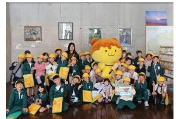
2年生 まちたんけん