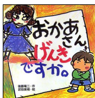
「おかあさん、げんきですか。」 後藤竜二・作