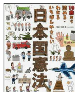
「10歳から読める・わかる いちばんやさしい 日本国憲法」 南野森・監修