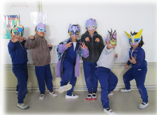
1・2年生仮面づくり(1/30)