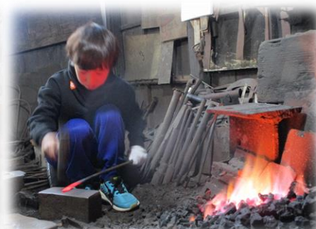
3年体験学習 荒川歴史民俗資料館・久保鍛造所(1/28)