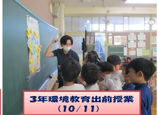
3年環境教育出前授業 (10/11)