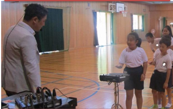
最新型音楽特別授業(10/18)