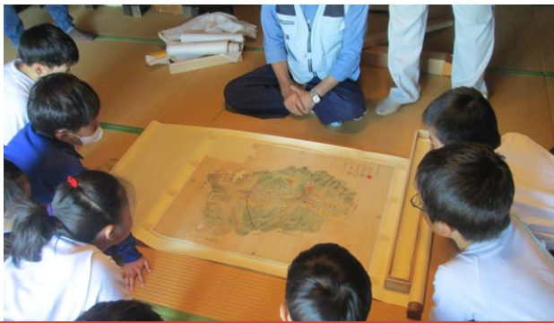
3年ステゴビル・平賀源内の古文書 (10/6)