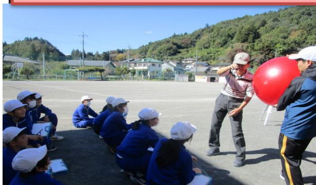
4・6年理科出前授業(10/24)