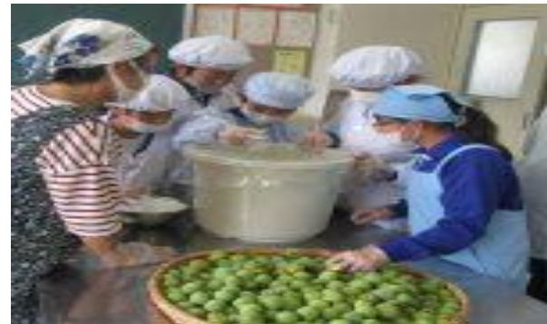
6年 梅干し作り (6/9) ～学校応援団の方にご指導いただきました～