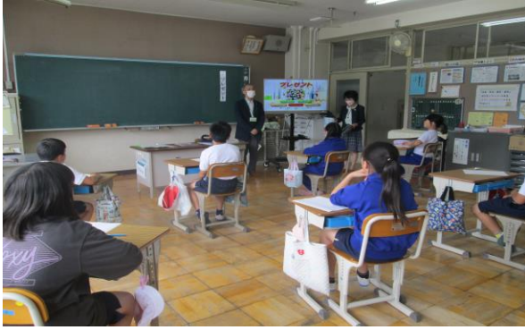
4年 人権教室 (6/1)