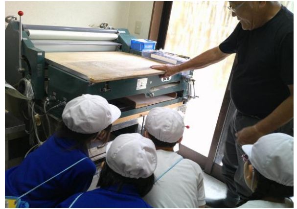
2年 町探検 (6/15) ～弁天茶屋さんを見学しました～