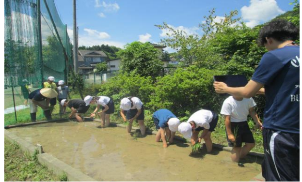
5年 田植え (6/7)