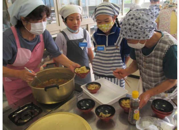
4年郷土料理づくり (6/20) ～長寿クラブの皆さんにご指導いただきました～