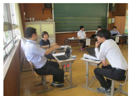
学校支援訪問授業研究会 3, 4年体育 (6/19)