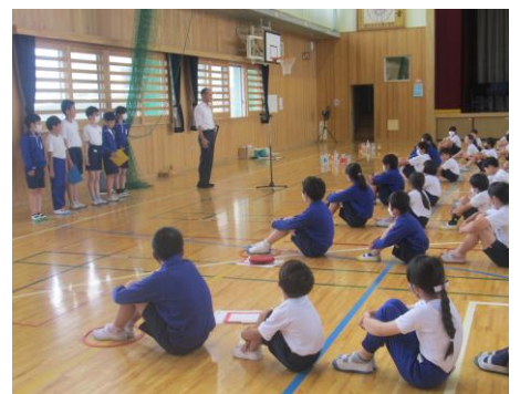
久那小まつり (6/28) ～久那幼稚園の園児も参加しました～