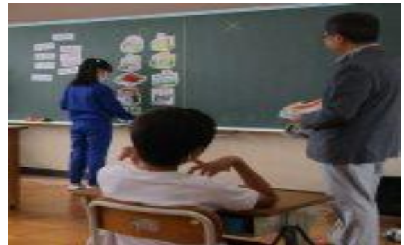
6年 租税教室 (6/12)