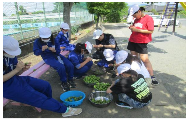
5. 6年 梅の実採り (6/7)