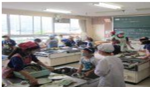
5年 調理実習 (6/12)