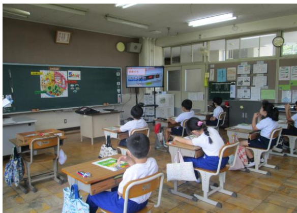
3年ベルクの食育出張授(7/6)