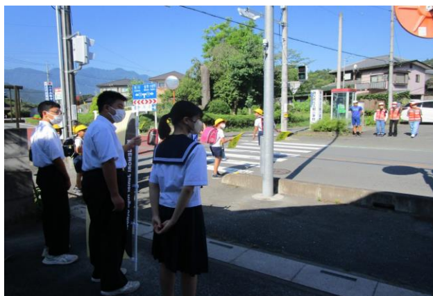
影中生あいさつ運動(7/10~14)