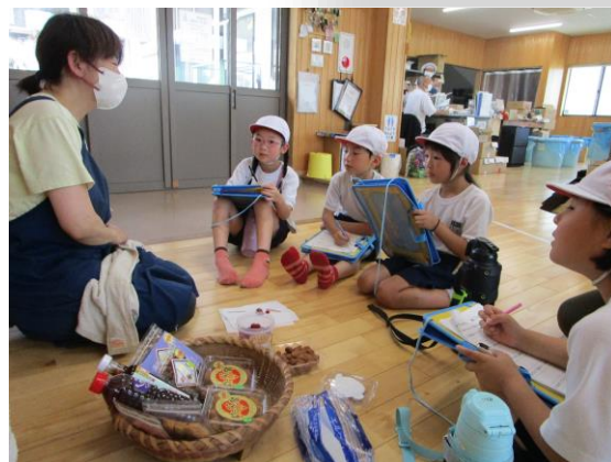
2年町探検 山叶本舗見学(7/12)