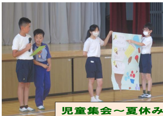
児童集会～夏休み前指導～(7/11)