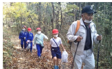
1年生 久那の小さい秋探し