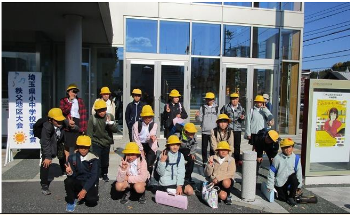
5. 6年秩父地区音楽会(11/11)