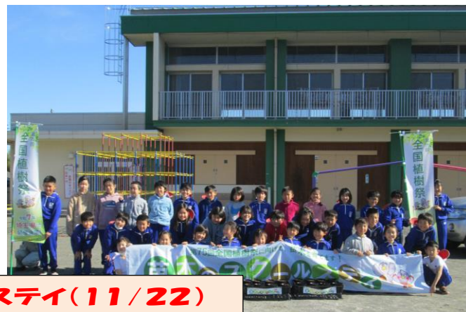
苗木のスクールステイ(11/22)