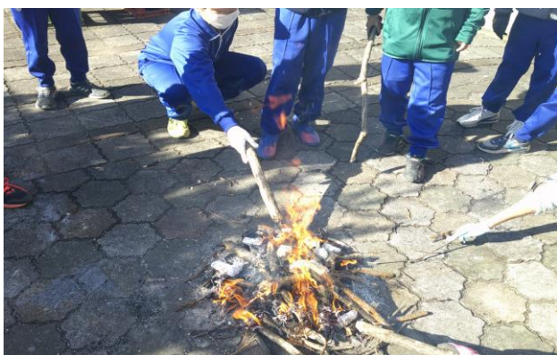
5年 収穫したお米で炊飯体験(11/15)