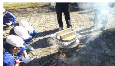
5年生 米作り 炊飯