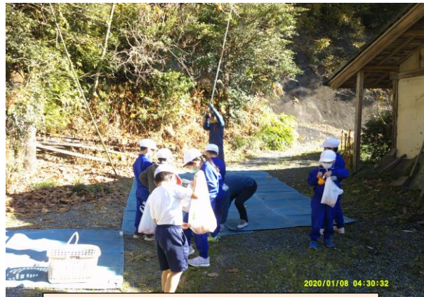
2年 柿取り (11/15)