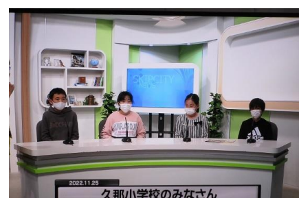
5・6年生 SKIPシティ スタジオ体験学習