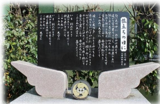
【歌碑「旅立ちの日に」】