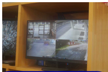
防犯カメラ用モニター