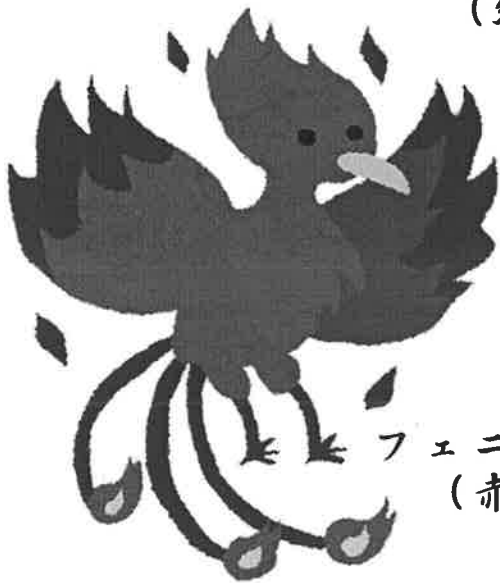
フェニックス (赤団)