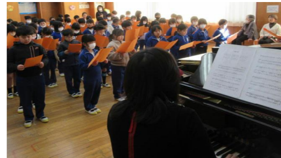
3年生 音楽授業のようす

1月16日(火)、先の3名の方を講師に迎え、本校3年生児童を対象に、音楽の授業を実施しました。3年生は、総合的な学習の時間や社会科などで、ふるさと秩父を学ぶ学習をしています。今回は、「和銅の歌」が作られた背景や作者の思いに触れることを通じて、ふるさとを大切にすることを育むことをねらいとし、音楽の授業を実施しました。