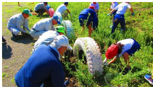
↑一昨年度の除草作業の様子です。