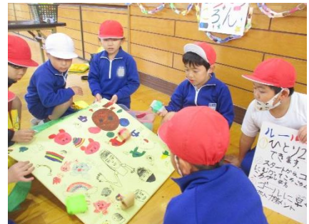
花小フェスティバル

その他、右の二次元コードから本校のホームページをご覧ください。 ご都合がよい時にご覧ください。 花の木小学校 検索