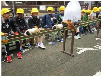
2年生生活科校外学習