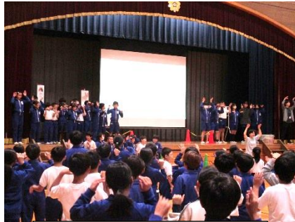
演劇ワークショップ