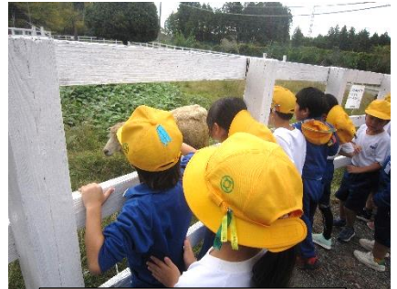
1年生生活科校外学習