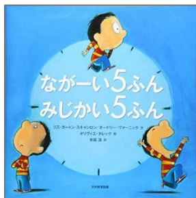
「ながーい5ぶん みじかい5ぶん」