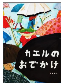
「カエルのおでかけ」