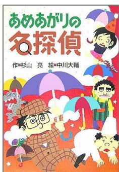
「あめあがりの名探偵」