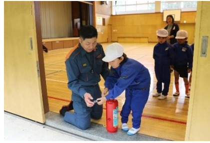
避難訓練・消火訓練