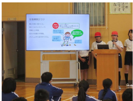
児童集会(運動・栽培委員会)