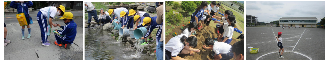
3年社会科地図作り