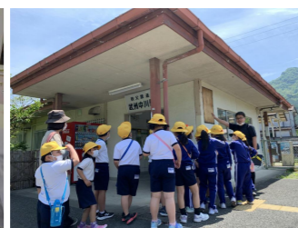
2年生活科校外学習