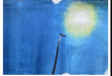
『見上げた その先には・・・』